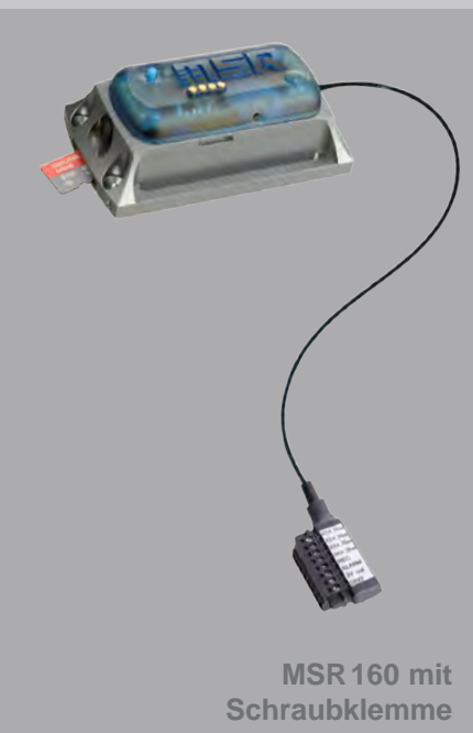
MSR 160 mit Schraubklemme

Vier Analogeingänge, eine hohe Messrate sowie die gigantische Speicherkapazität sind nebst dem kleinen Format die herausragenden Merkmale des Datenloggers MSR 160. Die analogen Eingänge des robusten Mini-Loggers können zum Anschliessen herkömmlicher Sensoren mit analogen Ausgängen (z.B. CO 2 , Leitfähigkeit, PH etc.) verwendet werden. Zusätzlich wird eine geschaltete Speisung zur Verfügung gestellt.