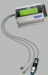
MSR 255 mit ext. Sensoren