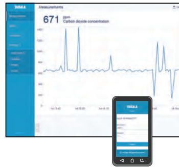
Beispiel eines WLAN Konfigurationsfensters.

Der Indigo 201 verfügt über eine WLAN-Konfigurationschnittstelle für ein Mobilgerät bzw. einen Rechner mit