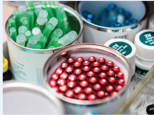
Vertrieb von Pharmazeutika