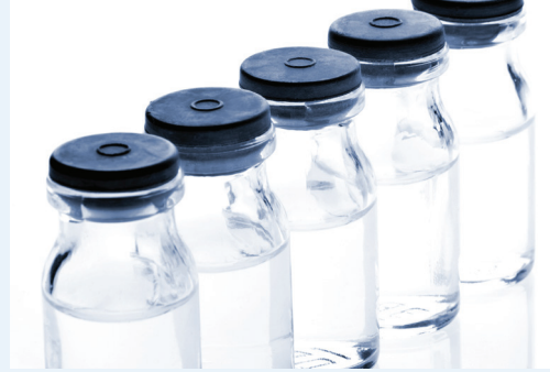
Transport von Impfstoffen