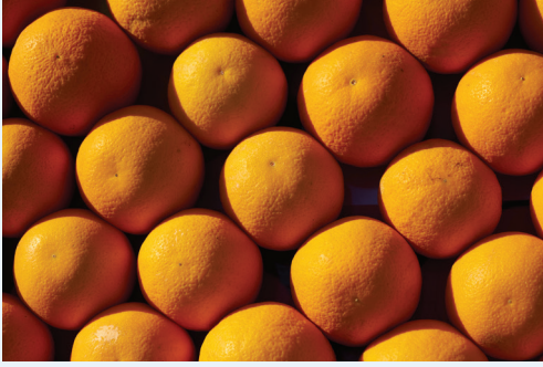
Versand von Obst/Gemüse/Erzeugnissen