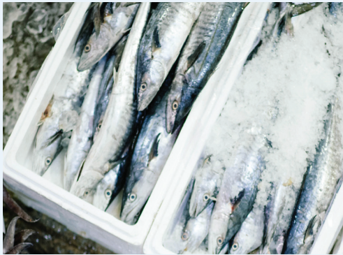
Versand von Meeresfrüchten / verderblichen Waren