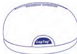
LTI-HID Nicht enthalten