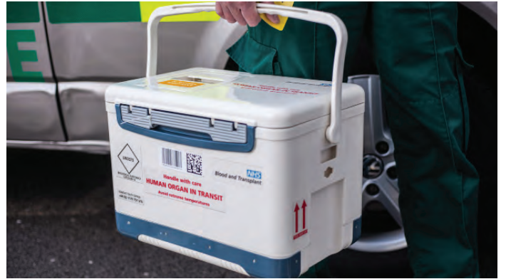
Blut- und Organtransporte