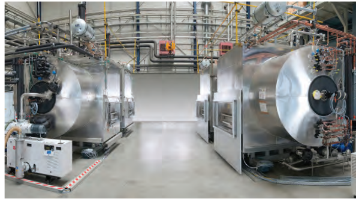
Auslieferungen in der Produktion