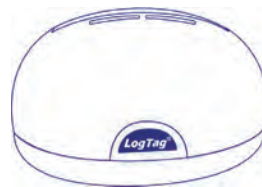
LTI-HID Nicht enthalten